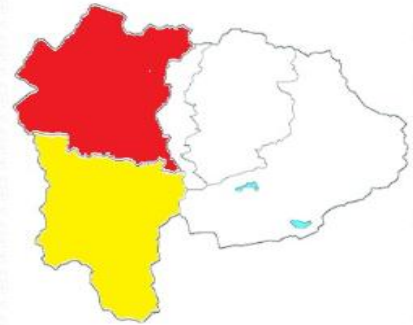
新型コロナウイルス感染症

全国の新型コロナウイルスの患者数が増加しています。今は第13波とも呼ばれる流行の波が来ていて、ウイルスの変異も続いています。人流が増えていること、暑いから屋内のイベントも増えています。ワクチンをうってから時間がたっていたり、マスクをしなくなってきたりして全体的に防御が緩んでいたりすることもおそらくあり、大きな流行が起きています。 のどの激しい痛み が特徴の変異株「 ニンバス 」とその系統が、割を占めており、 ニンバス は、これまでのもの比べてやや感染力が強いとされていますが、重症化する割合などに大きな差はないとみられています。